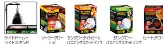
ライトドーム+ライトスタンド ソーラーグローUV サングローバスキングスポットランプ ヒートグローバスキングスポットランプ

照射器具: ライトドーム(ライトスタンド) ランプ: 昼間はソーラーグローUV・サングロー、夜間はヒートグローがオススメ