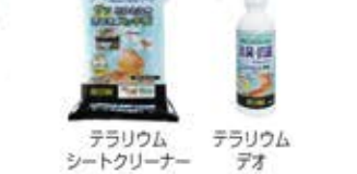
テラリウムシートクリーナー テラリウムデオ