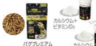
カルシウム+ ビタミンD3 カルシウム