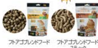
フトアゴプレッドフード フトアゴプレッドフードスティック

雑食性なので、昆虫や野菜、ペレットフードなどなんでも良く食べます。フトアゴ専用のフードは栄養バランスを考えて作られているので便利です。栄養のかたよりの回避、骨の形成のためにもビタミン類(マルチビタミンなど)やカルシウムは必要です。カルシウム+ビタミンD3は毎日、カルシウムは月1~2回を目安にえさに混ぜて与えてください。D3が添加されているカルシウム剤はカルシウムの吸収が促進されますのでオススメです。