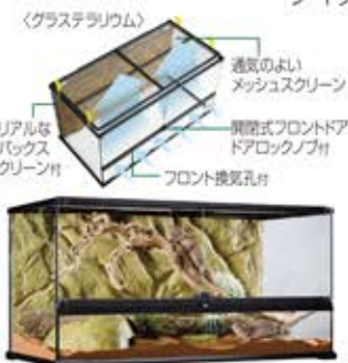
〈ディスプレイ例〉 ガラステラリウム9045(幅90cmタイプ) 体長目安40~60cm

お手入れ、お世話がしやすいフロントドア・ガラス製のケージが便利です。体長に合わせてケージを大きくし、動ける空間を十分に確保してあげてください。