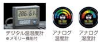
デジタル温度湿度計 ※メモリー機能付 アナログ温度計 アナログ湿度計