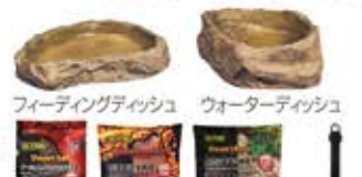
フィーディングディッシュ ウォーターディッシュ