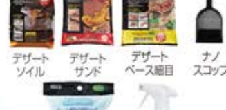
デザートソイル デザートサンド デザートベース ナノスコップ