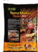
テラメーカー デザート