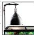
ライトドーム+ ライトスタンド

照射器具: ライトドーム(ライトスタンド) ランプ: 昼間はソーラークローUV・サングロー、 夜間はヒートグローがオススメ