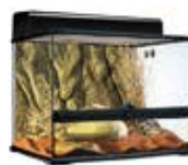
〈ディスプレイ例〉 ガラステラリウム6045 (幅60cmタイプ) 甲長目安: 10~15cm

リクガメが隠れることのできるシェルター(甲羅がすっぽり入るサイズ)を用意してあげてください。クールダウンや紫外線回避、ストレス回避のためにも隠れたり、落ち着ける場所を作ってあげてください。