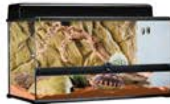
〈ディスプレイ例〉 ガラステラリウム9045 (幅90cmタイプ) 甲長目安: 15~20cm